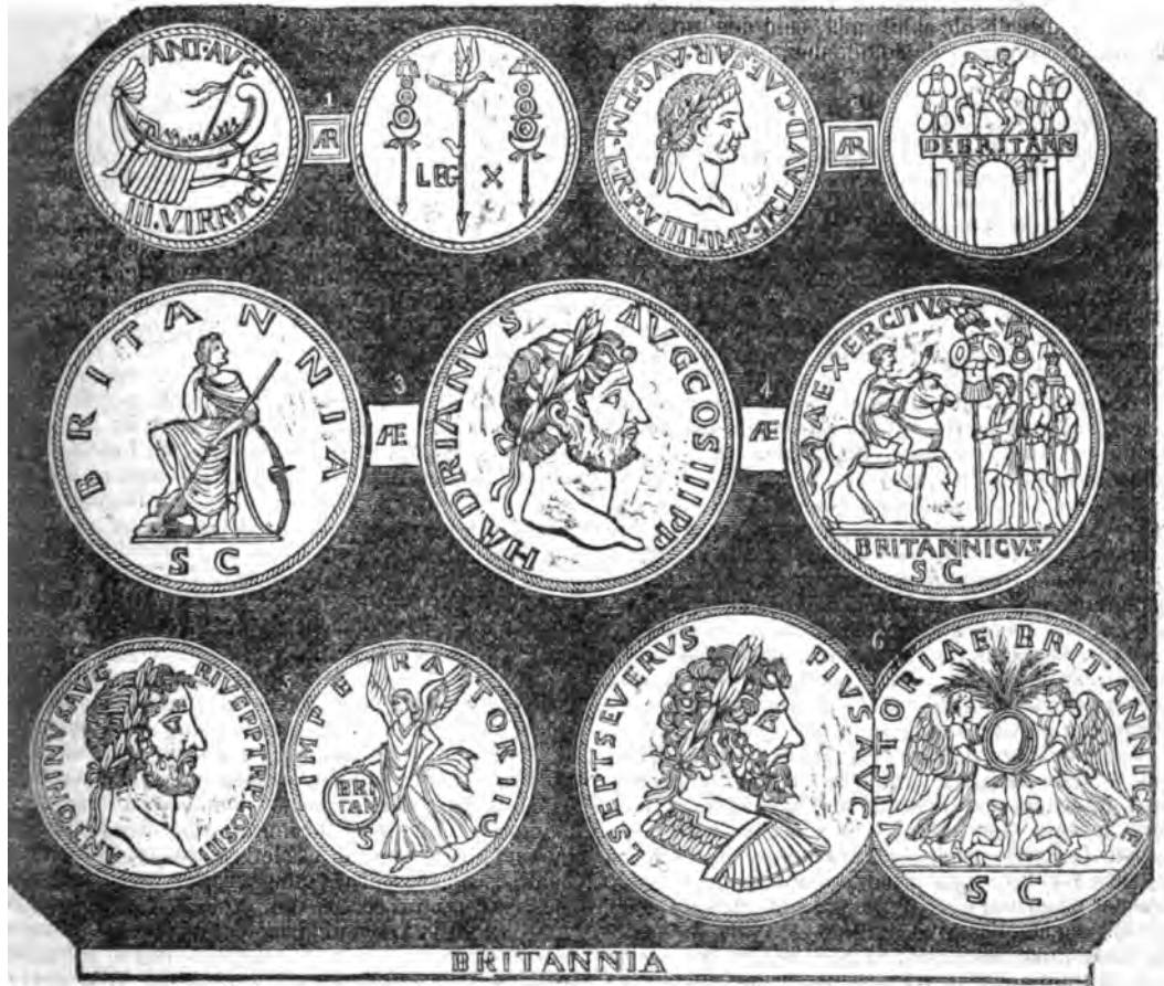
1. Primus nummus argenteus legionis x ex An-tonianis frequentibus, effossus in agro Maridunensi nter Dimetas, qui Silurum pars suere, illustratur a Thoma Gale in celebri opusculo ad Itinerarium Bri-tannicum Antonini pag. 122. Hanc legionem in Bri-

Liceat mihi ad comprobandum Britanniae provin-ciae statum sub Romanis imperatoribus primi, et secundi sæculi (a qua notitia separari minime potest cognitio primæ constitutionis illius Ecclesiae), in medium producere nonnulla documenta genuinæ antiquitatis, decerpta ex opere ampliori, quod par-abam ad universas provincias ecclesiasticas singul-latum illustrandas. Inde seligam pauca ex pluribus quæ collegeram ad Britanniae constitutionem perti-nentibus. Numismata sex huic tabellæ graphice ins-culpta comprobant statum Britanniae provinciae sub Romanis ab Augusto ad Severum principem. Provin-ciae, inquam, non provinciarum; cum nec Severi duas ἡγεμονίας , nec quatuor provincias Constantini, aut quinque Valentiniani adhuc Britannia admi-sisset.