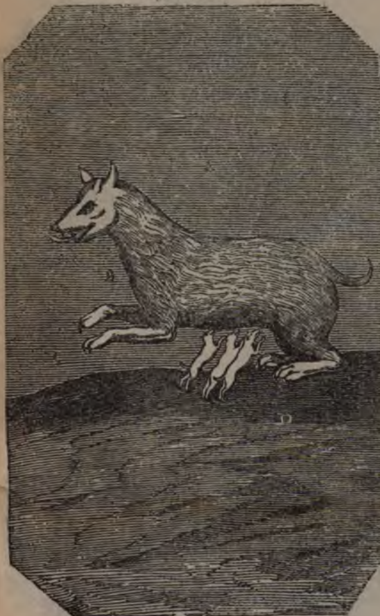
Figure 7. PATROL. GR. CVII.