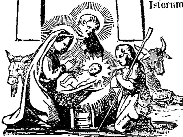
Fundamentum Humilitatis et prototypu

Memineris, lector, hosce gradus humilitatis proprie et potissimum ad monachos et religiosos pertinere, quibus etiam S. Benedictus eos commendat et proponit ascendendos, ut ad culmen charitatis, in qua perfectio religionis consistit, perveniant.