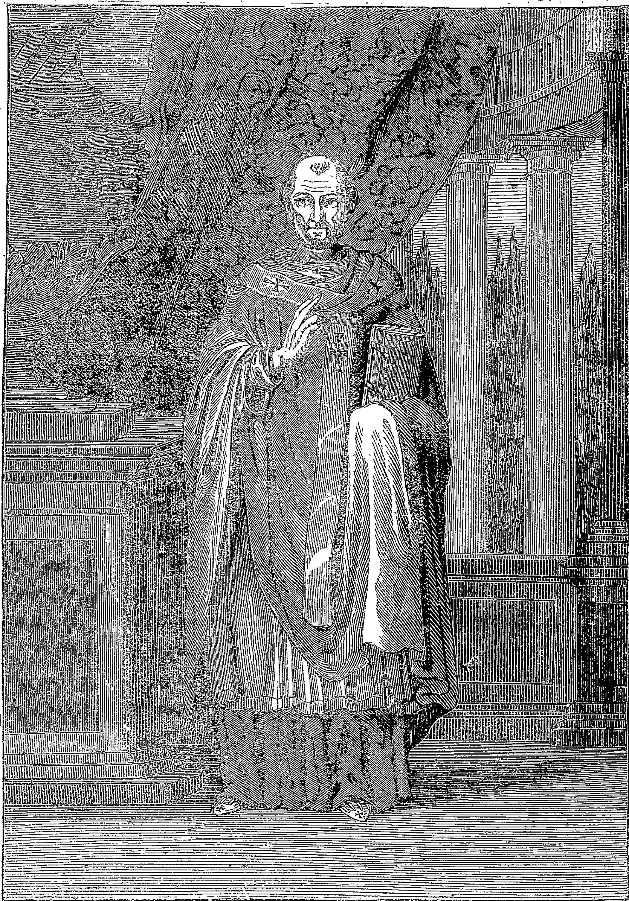
VERA S. GREGORII MAGNI EFFIGIES.