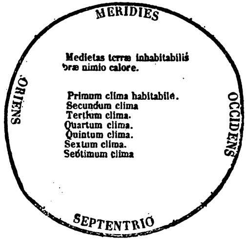
Extremitas septentrionalis inhabitabilis frigore

PETRUS. Opinio ista visus obstat effectui. Visu enim probamus Aren in medio terræ sitam, et initium Arietis et Libræ super eam recta progredi linea, aeremque ibi temperatissimum esse, adeo ut veris, æstatis, autumnis, et hiemis, semper ibi fere tempus sit æquale, ibi aromaticæ species pulchri coloris et mellifluis nascuntur saporis. Corpora quoque hominum non macilentia ibi sunt nimis aut pingua, sed mediocris sicuti discretionem decora. Temporis quoque temperies hominum corpora sibi consona reddit, et pecora, quia ineffabili pollent sapientia et naturali justitia. Quomodo igitur quisquam dicere præsumat locum super quem sol recta præterit linea inhabitabilem esse? Potius totum terræ habitabile spatium existit continuum a prædicto loco usque ad septentrionalem globum, quod antiqui in septem dividerunt partes, quas septem climata vocaverunt, secundum numerum septem planetarum. Primum ex illis est in media linea, ubi Aren civitas est condita, septimum autem septentrionalis orbis tenet extremum, reliqua vero medium continent spatium. Nullus est inhabitabilis locus, nisi ubi vel multarum arenarum siccitas cum aqua modica, vel montium asperitas aratri non patitur onera. Hæc omnia autem oculis subjecta figura demonstrat :